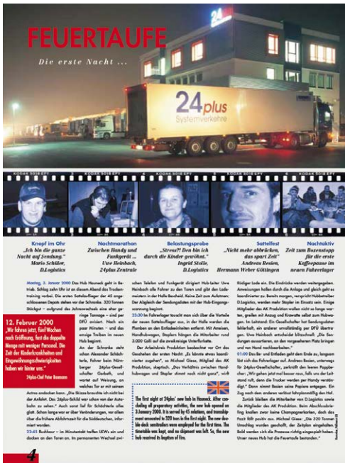
In der Ausgabe 1/2000 berichtet die 24plusPunkte ausführlich über die Eröffnung des Zentralhubs. Umschlagmenge in der ersten Nacht: 320 Tonnen.