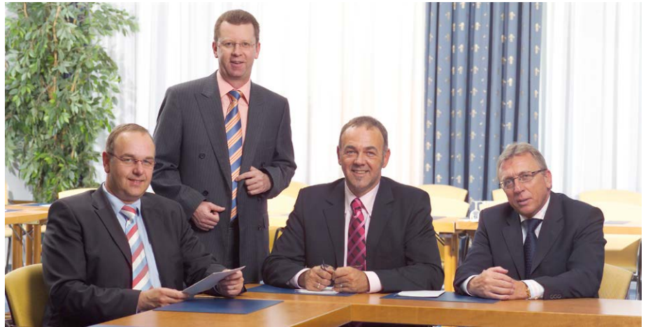
Aufsichtsrat und Geschäftsführung im Jahr 2006.