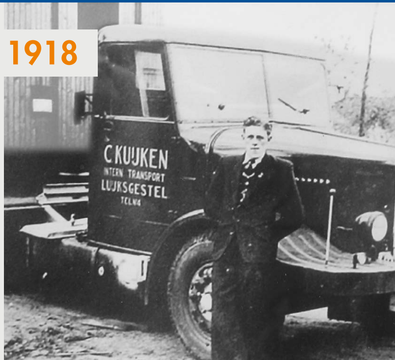
Als 50 Kilometer noch Fernverkehr waren ...