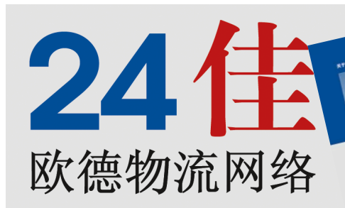
2006 zählte 24plus zu den Ausstellern der transport logistic China in Shanghai. Seither gibt es eine chinesische Version des Logos.