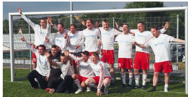
Kick, cheer, celebrate: 2006 witnessed the first 24plus fever pitch. In 2015, the employee event took place for the fourth time.