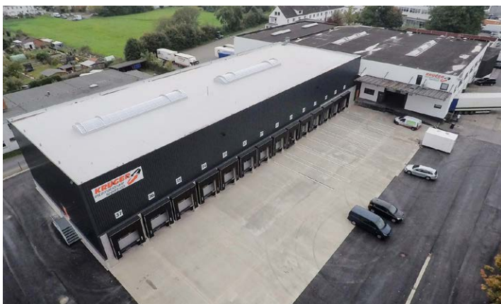
Erst 2017 hat die Krüger Internationale Spedition GmbH eine zusätzliche Stückgutumschlaghalle errichtet und bezogen.

Die Aufteilung des früheren Nahverkehrsgebiets der Niederlassung Reichenbach der d+s logistic auf zwei 24plus-Partner ermöglicht nun kürzere Wege im Nahverkehr.