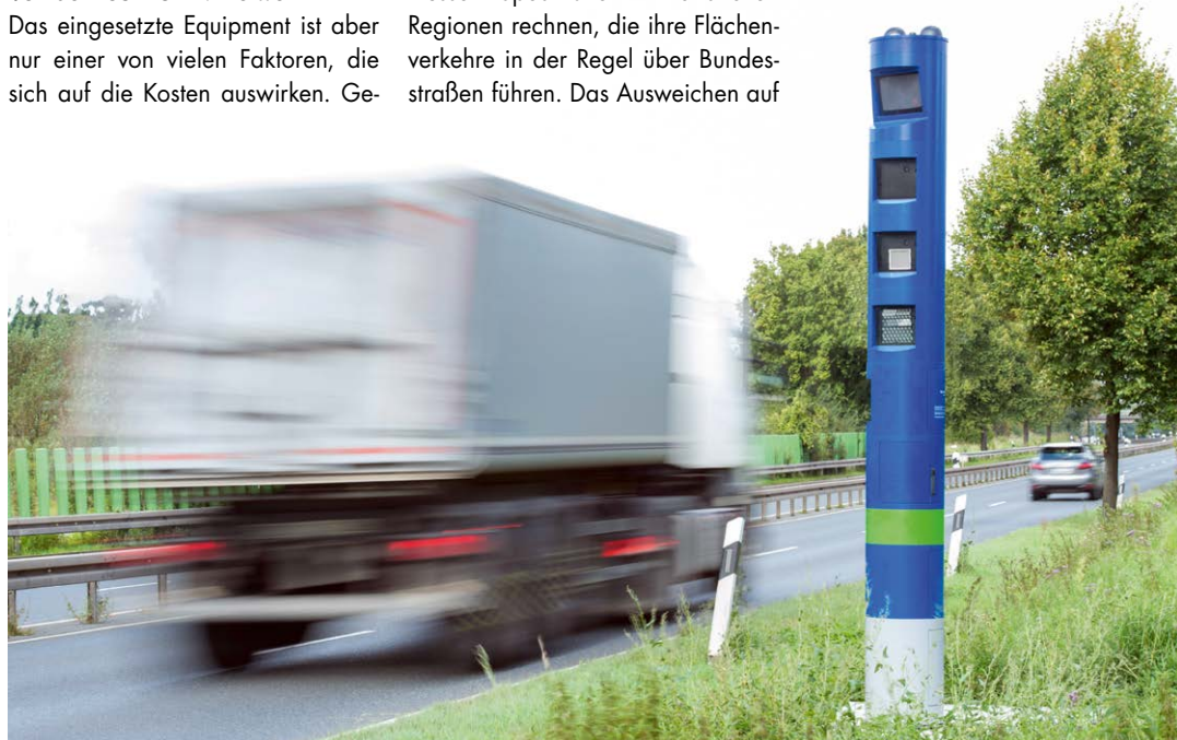
Das ist kein Blitzer für Temposünder. Mit diesen Säulen wird die Lkw-Maut auf Bundesstraßen kontrolliert.

Als Fazit bleibt: Mit zukünftig jährlich 7,2 Milliarden Euro an Erlösen für den Bund ist die Lkw-Maut zu einem wichtigen Bilanzposten in der volkswirtschaftlichen Rechnung geworden. Die Lkw-Maut trägt annähernd so viel zum Staatshaushalt bei wie die Kfz-Steuer. Die Transportwirtschaft muss die Kosten der Maut verursachergerecht an ihre Kunden weitergeben – und auch diese sind gezwungen, die Mautkosten einzupreisen. Am Ende trägt der Verbraucher die Mehrkosten. Die Lkw-Maut ist damit eine Sonderform der Mehrwertsteuer. Doch anders als die Mehrwertsteuereinnahmen sind die Einnahmen aus der Maut – in der Theorie – zweckgebunden für den Erhalt und den Ausbau der Verkehrsinfrastruktur. Seit dem Start der Lkw-Maut in Deutschland im Jahr 2005 sind daraus 53 Milliarden Euro in den Staatssäckel geflossen. Die Hoffnung, dass dieser Geldregen zu einer spürbaren Verbesserung der Infrastruktur führt, hat sich indes nicht erfüllt. Der Zustand vieler Bundesstraßen und Bundesautobahnen wurde von Jahr zu Jahr maroder. Ob sich der Trend mit der Mautausweitung umkehren wird, darf getrost bezweifelt werden.