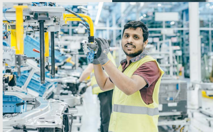
Für IT-Kunden übernimmt der Logistiker LGI die Softwarebespielung (Bild oben), für Kunden aus dem Automotive-Bereich diverse Vormontagen (Bild links).

Logistician LGI assumes the software installation for IT customers (top image) and various stages of pre-assembly for customers from the automotive sector (image on the left).