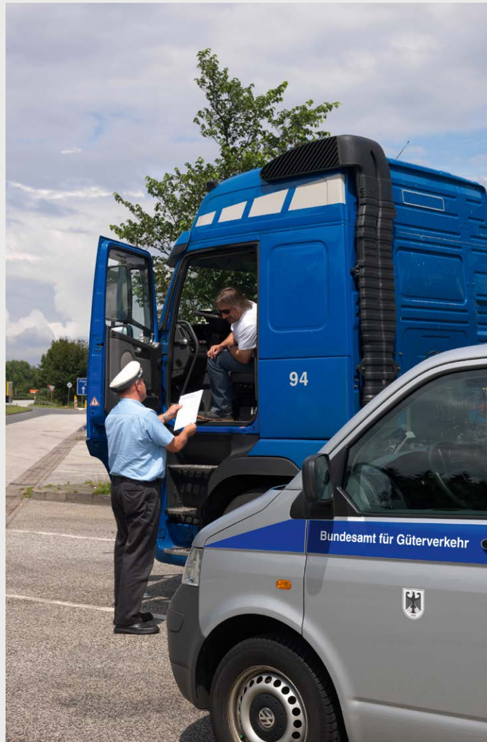
Ein engmaschiges Kontrollnetz aus Mautbrücken an den Autobahnen, Kontrollsäulen an den Bundesstraßen und mobilen Einheiten des Bundesamts für Güterkraftverkehr sorgt dafür, dass Mautpreller in Deutschland keine Chance haben.

On the order of the German Forwarding and Logistics Association (DSLIV), the Steinbeis Beratungszentrum Forwarding and Logistics Center (Forlogic) has calculated these industry-wide averages on the basis of 1,800 tour profiles at 55 depots of 10 LCL co-operations and networks in Germany. The DSLIV study comes to the conclusion that the toll cost