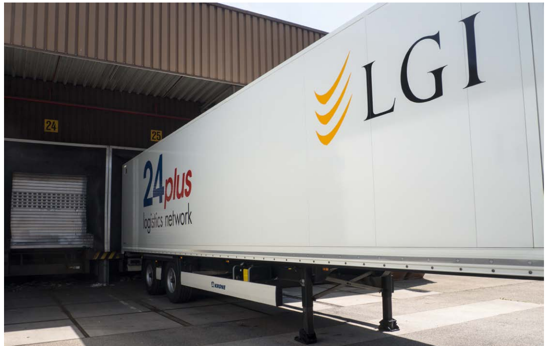
Komplexe Logistikprojekte sind die Stärke von LGI.